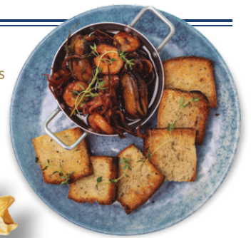
CONFIT DE FRUTOS DO MAR