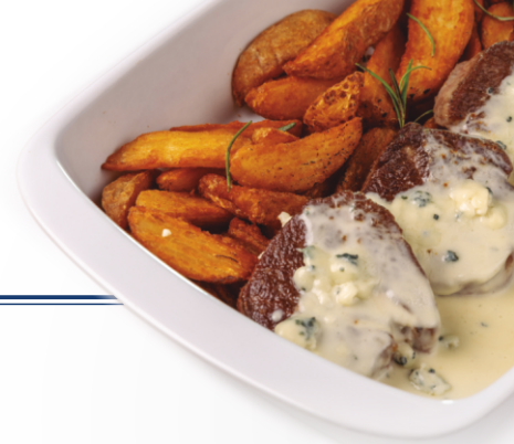
MIGNON AO MOLHO GORGONZOLA