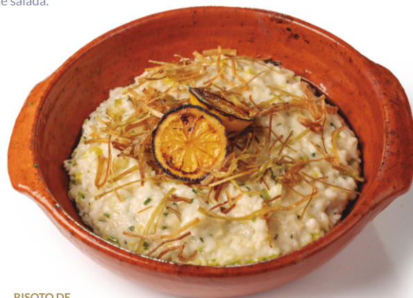
RISOTO DE ALHO PORÓ

Medalhão de filé mignon grelhado, sobre cama de batatas rústicas, regado em molho de creme de leite fresco e gorgonzola. Servido com arroz branco e salada.