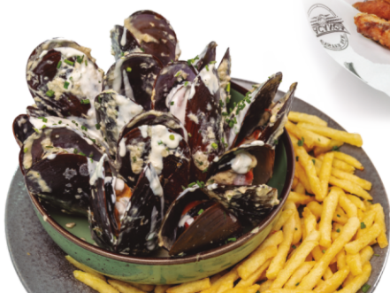
MULES ET FRITES