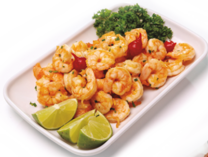
CAMARÃO ALHO E ÓLEO

Pura Carne de siri de pesca local (Laguna-SC), refogada com leite de Côco e temperos.