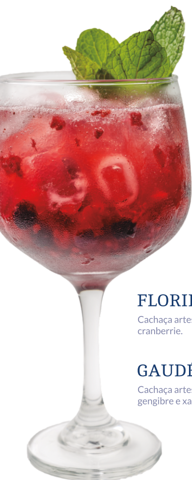
GIN TÔNICA TROPICAL

Cachaça artesanal, morango e limão siciliano.