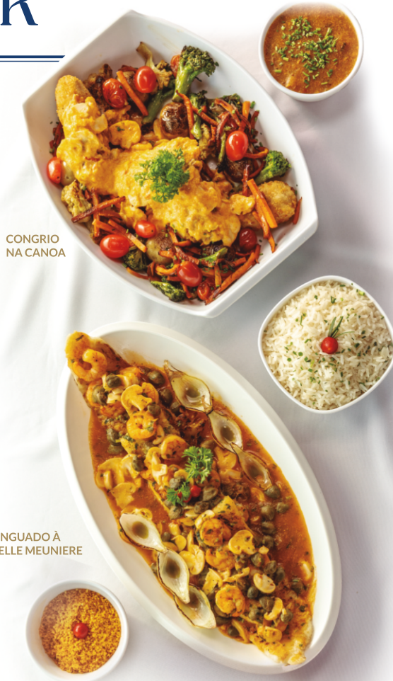
CONGRIO NA CANOA