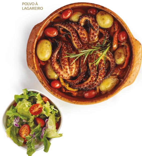
POLVO À LAGAREIRO

Filé de salmão grelhado, com pele crocante e interior suculento, regado com molho de maracujá. Acompanha purê de batata baroa e salada.