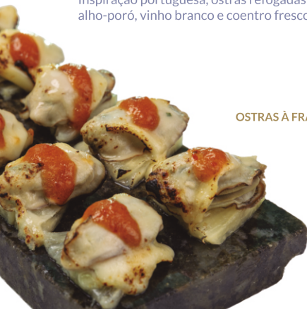
OSTRAS À FRANCESA

Inspiração portuguesa, ostras refogadas em azeite de oliva, cebola roxa, alho-poró, vinho branco e coentro fresco.