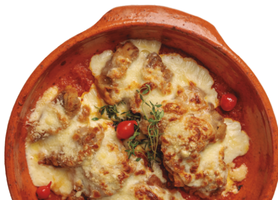
MIGNON À PARMEGIANA

Arroz arbóreo cozido lentamente em vinho branco e parmesão curado, finalizado com alho Poró salteado na manteiga e raspas de limão siciliano. Cremoso, leve, com notas cítricas. Acompanha salada.