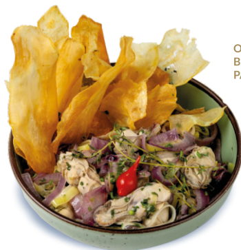
OSTRAS À BULHÃO PATO

Ostras envoltas em molho de gorgonzola e finalizadas com crispy de alho-poró.