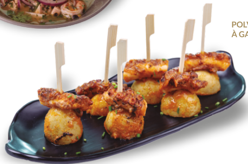
POLVO À GALEGA